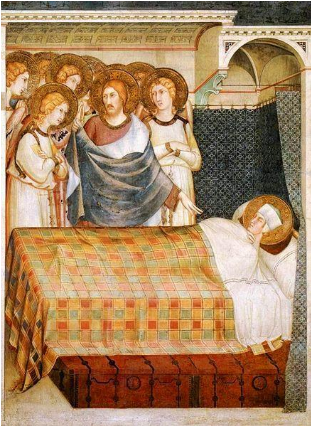
(Simone Martini, ca. 1321, St. Martin Kapelle der Unterkirche, San Francesco, Assisi, Italien)